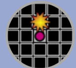
GRILLE DE VISÉE

Sur les Atouts de tir, une grille de visée indique la position du Zoon qui l'utilise ainsi que les cases pouvant être prises pour cible, indiquées par le symbole .