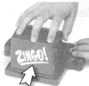
Placez en arrière