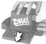
Placez le distributeur en avant

• Le diviseur place le distributeur ZINGO en avant, puis en arrière afin que 2 pièces sortent.