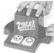
Les Pièces Zingo sont visibles