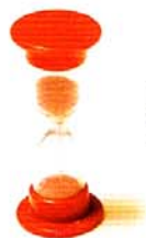
Le sablier de 20 secondes