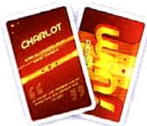
Les cartes PERSONNAGE