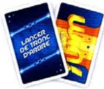
Les cartes ÉPREUVE