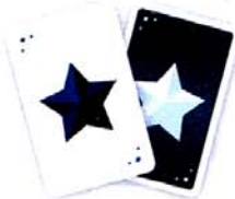
Les cartes VOTE