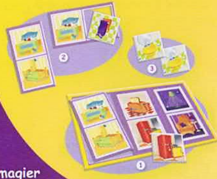
Imagier de la maison