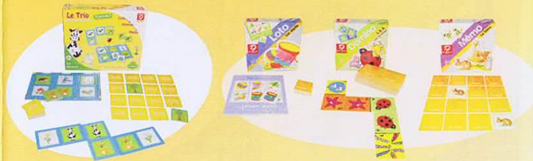
Le Trio des jeux d'Eveil

Les prochains thèmes de la gamme proposeront des associations d'images non identiques mais qui ont un lien logique, comme par exemple un animal et son lieu de vie. Ce sera alors la première fois qu'un jeu d'éveil permettra de jouer au Mémo en faisant des paires d'images différentes. Ce qui revient à combiner les capacités d'association logique et de mémorisation et ainsi aller encore plus loin dans l'ancrage des apprentissages, le tout en s'amusant !