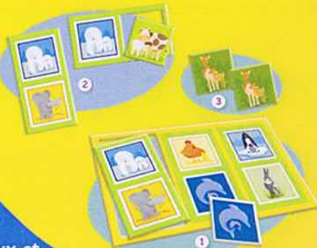
Les Animaux et leurs petits