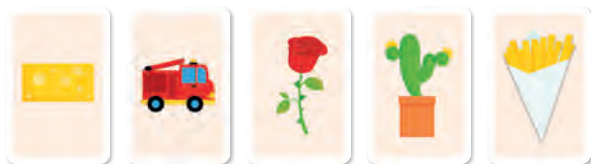
Cartes du joueur 1