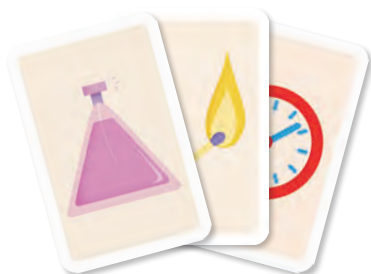
Une face Objet