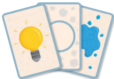
Une face Caractéristique (bordure bleue)