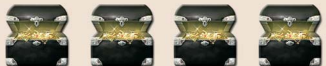
Verso des coffres