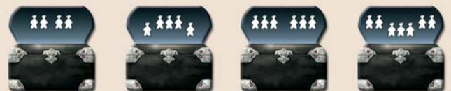
Recto des coffres