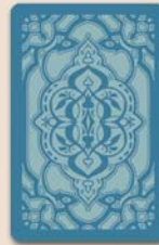
Verso des cartes