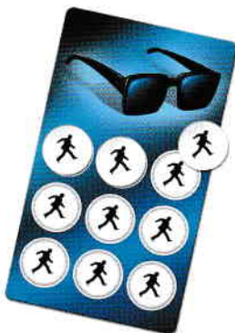
Planche MISTER X