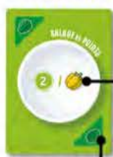
TYPE DE LÉGUME DE L'AUTRE CÔTÉ