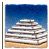
Pyramide à degrés