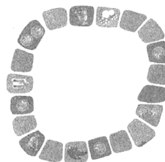
2• Chemin des frères