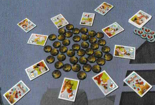
Exemple de début de tour à 4 joueurs

Pour commencer, retourner 8 cartes Poules face visible et les placer en cercle/rond autour des Vers de Terre de façon à ce que tout le monde puisse les voir. Chaque carte Poule indique son Ver de Terre préféré qu'il faudra trouver pour la séduire, ainsi que le nombre de points qu'elle fera gagner à la fin de la partie.