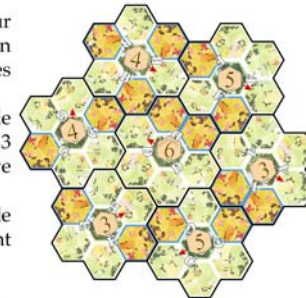
Exemple de disposition initiale.

Rangez les écrans, les pions et les habitants non utilisés.