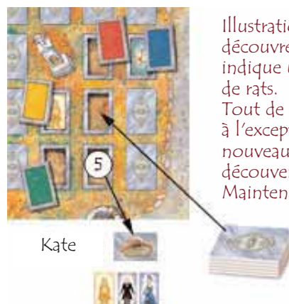
Illustration 4d : elle retourne un couvercle (5) et découvre vraiment un caveau libre. Mais le verso indique un autre rat qui provoque une nouvelle plaie de rats.

Kate takes the new rat lid and puts it in front of her and starts the new rat plague.