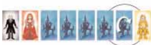
Fig. 2: Once Kate has disposed of her green vampire, she immediately turns over the next face-down vampire (white circle), on the same side of the card row.

If he only has 4 or less vampires left, these all have to be face-up in front of him. A player can never change the order of his vampires.