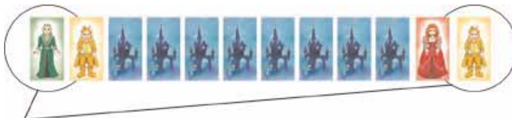
Fig. 1: At the beginning of the game, each player turns over 2 vampires at each end (left and right) of his vampire row. Only the outermost vampires (within the white circles) are compared to the grave lid color. In this example, the player has to find either a green or a yellow grave lid in order to put one of his vampires to rest.