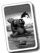
1 case + une fois Nino Delfino

Tire la première carte de la pile. Sur les cartes, tu vois de combien de cases tu dois faire avancer un de tes phoques et si Nino Delfino va sauter ou non :