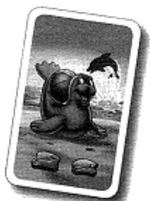
2 case + une fois Nino Delfino