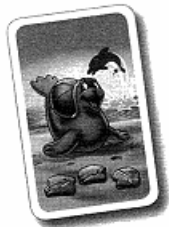
3 case + une fois Nino Delfino