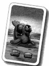
2 case, Nino Delfino ne saute pas

Les cartes retournées doivent être mises de côté. Lorsque toutes les cartes ont été retournées, il faut bien les mélanger et les replacer – faces cachées – en pile à côté du jeu.