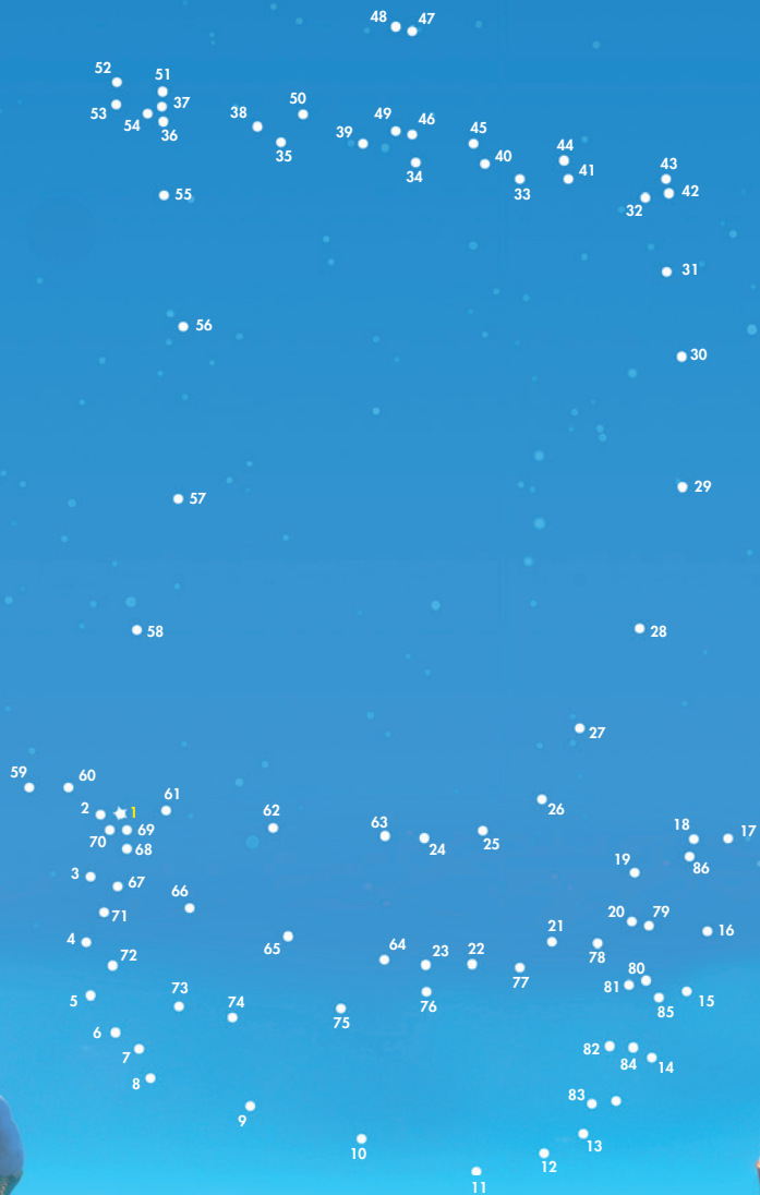
C'EST LE BÂTEAU DE JASON & LES ARGONAUTES