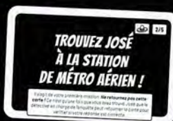
Carte enquête, recto

Il ne s'agit pas de simplement deviner ! Vous devez trouver, sur le plan, la scène confirmant votre théorie.