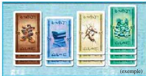
Ill. 2a : les actions non distribuées aux joueurs sont posées faces visibles à côté du plateau.