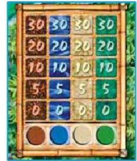
Ill. 2b : la situation du marché noir au début de la partie.