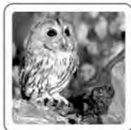
La chouette hulule.

Et le vainqueur de la partie crie « Youpi ! »