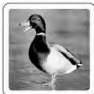
Le canard cancaie.