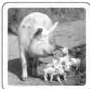
Le cochon grouine.