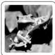
La grenouille coasse.