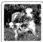
La vache meugle.