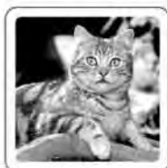
Le chat miaule.