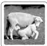
Le mouton bêle.