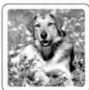
Le chien aboie.