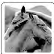
Le cheval hennie.