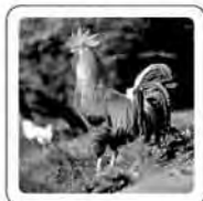
Le coq chante.