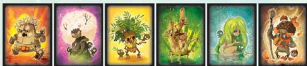
Le Baobab Le Cerisier Le Palmier Le Bambou Le Saule Le Chêne

■ 6 tuiles Créature représentant les esprits de la Nature