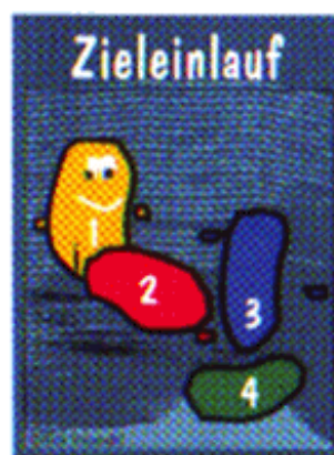
Exemple de carte d'objectif

Cette carte indique dans quel ordre chaque joueur doit respectivement amener les concombres au but, par exemple 1. Jaune, 2. Rouge, 3. Bleu, 4. Vert.