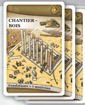
chantiers urbains à 3 joueurs

Partie d'initiation : Afin d'accélérer votre partie d'initiation, utilisez un maximum de 3 cartes Chantier urbains de chaque type et retirez la moitié des cartes Commande de la pioche.