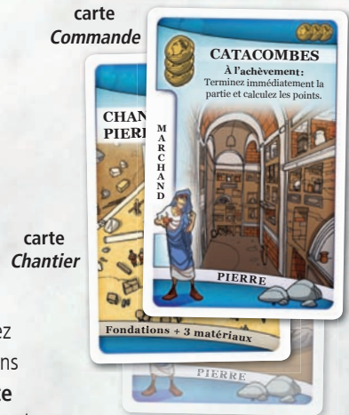
Les matériaux sont placés sous le chantier.

Avec l'action Artisan , vous procédez de la même manière, à l'exception du fait que la carte provient de votre main et non de vos stocks.