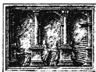
Case départ de l'échelle de popularité

Le plan de jeu représente le forum à Rome et est divisé en 7 \times 7 = 49 cases. Autour de la place centrale, il y a 7 bâtiments, 7 rangées verticales, 7 rangées horizontales et 2 diagonales. Les bâtiments sont composés de 6 à 9 cases, les rangées et les diagonales de 7 cases chacune. Chaque rangée, diagonale ou bâtiment, représente un domaine de la Rome antique.