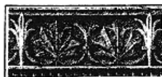
Deux cases de l'échelle de popularité