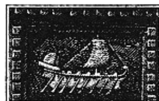
Un domaine de la vie publique (la navigation)