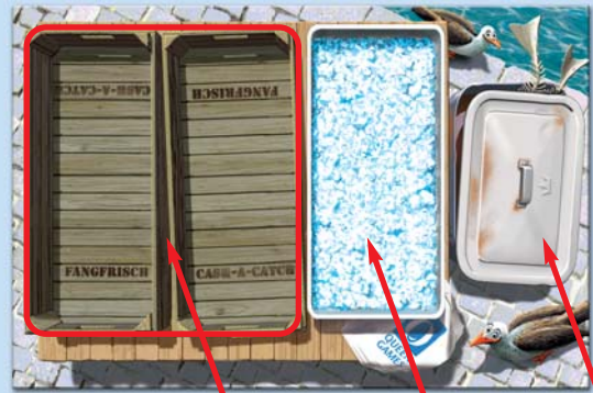
3 emplacements : 2 caisses et 1 bassine