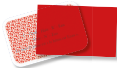
1 FILTRE ROUGE