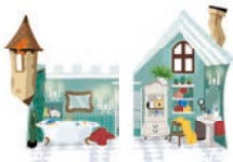
Salle de bain ②