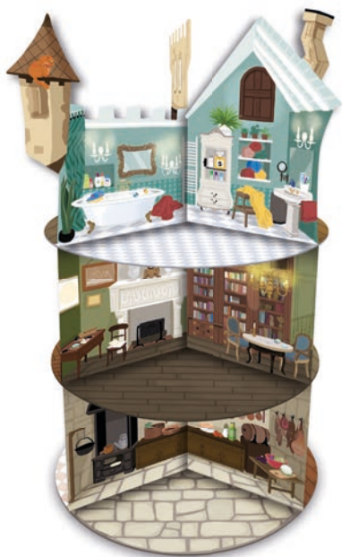
1 CHÂTEAU À MONTER