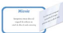
1 CARTE MIROIR