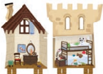
Chambre des enfants ①