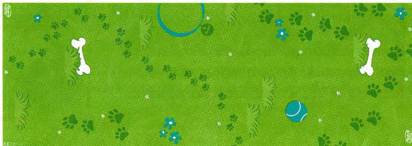
tapis de jeu