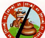
roulette avec flèche et base