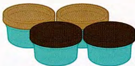
4 pots de pâte à modeler