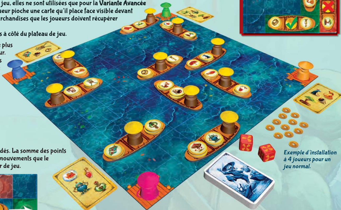
Exemple d'installation à 4 joueurs pour un jeu normal.