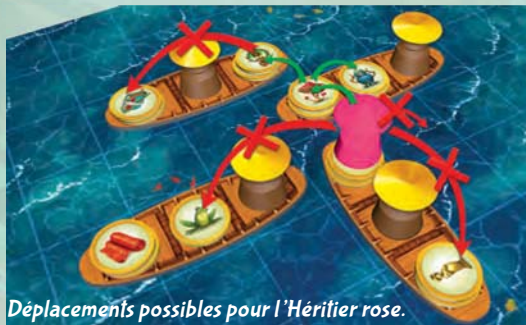
Déplacements possibles pour l'Héritier rose.

THANH : « DAO, FAIS ATTENTION ! TU VAS CRÉER UN ACCIDENT ! »