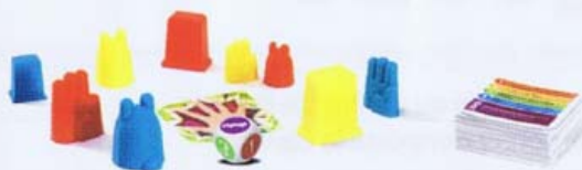
Image non contractuelle, couleurs et formes sont susceptibles d'être modifiées.

➔ 3 figurines Cyclo de tailles et de couleurs différentes