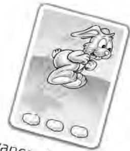
Avance de 3 cases