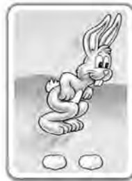
Avance de 2 cases