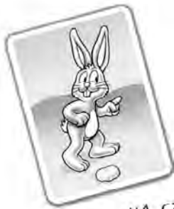
Avance d'1 case

Lorsque tu retournes une carte représentant un lapin, avance l'un de tes lapins vers le sommet du nombre de cases indiqué.