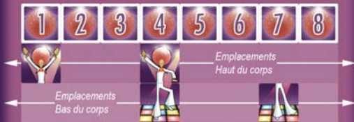
Schéma : exemple de chorégraphie

2) L'équipe B se place debout en face des cartes et le jury lance la musique. Les danseurs disposent de 5 essais pour s'entraîner, c'est-à-dire qu'ils tentent d'enchaîner 5 passages de 8 temps.