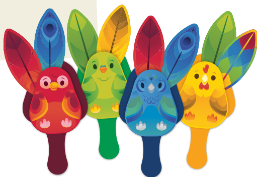
Oiseaux « porte-plumes »