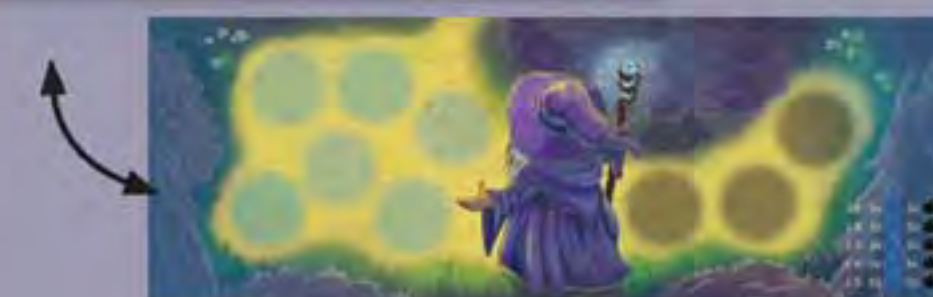
1 Plateau Arrivée Élias recto-verso