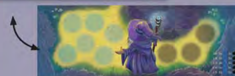
1 Plateau Arrivée Élias recto-verso