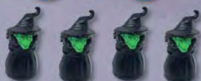
4 Figurines Sorcière