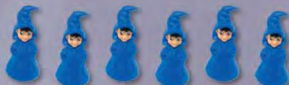
6 Figurines Apprenti