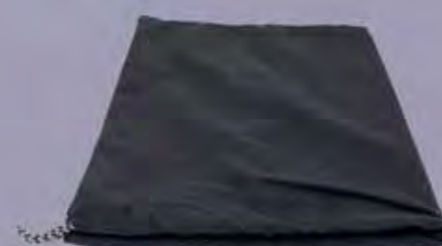
1 sac en tissu