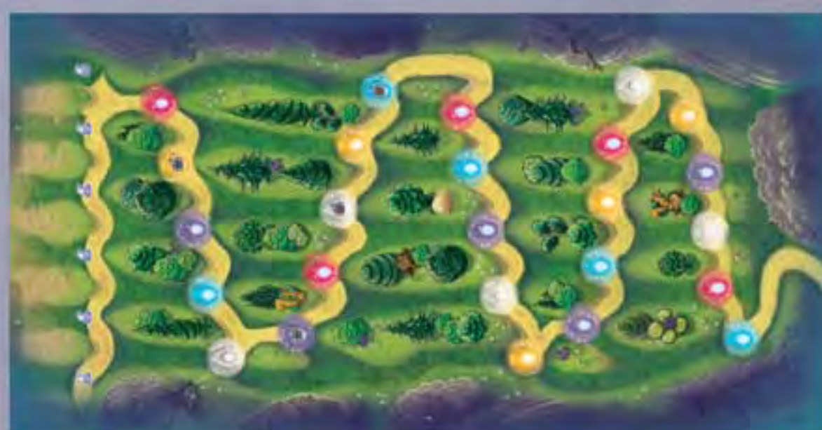
1 Plateau de jeu avec 4 supports (n°1, 2 et 3)