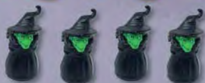
4 Figurines Sorcière