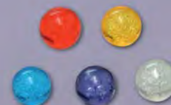
5 Feux follets (billes) : rouge, jaune, violet, bleu et blanc