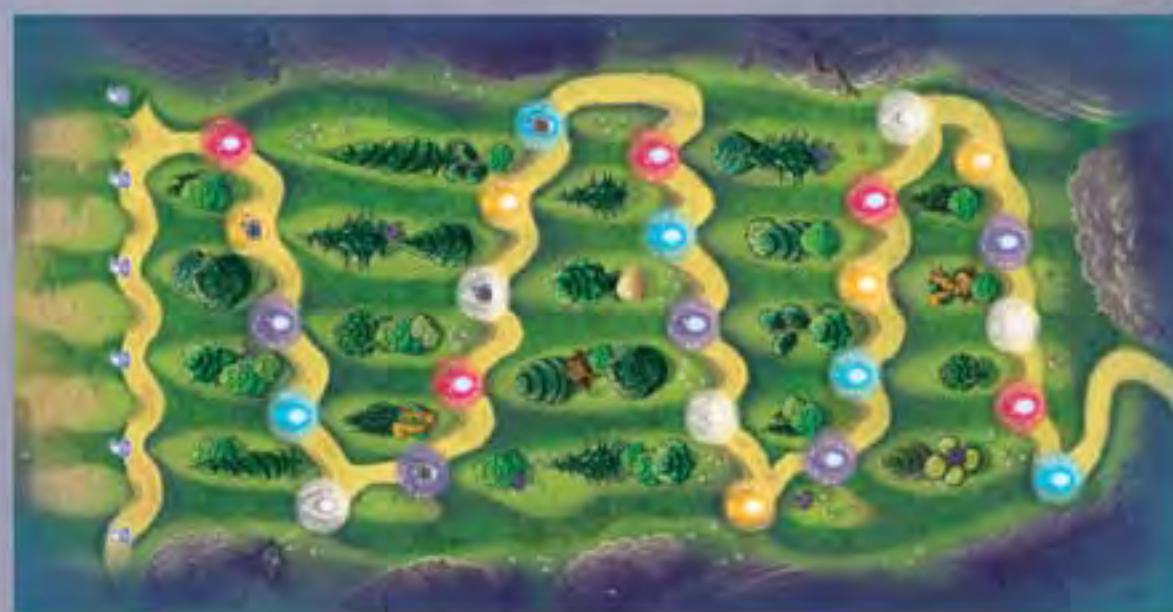
1 Plateau de jeu avec 4 supports (n°1, 2 et 3)