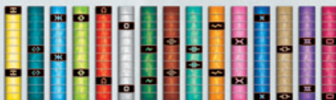
Un assortiment de bandes pour chaque joueur

Ensuite, vous avez besoin des tableaux. Avant de les distribuer, tous les joueurs décident ensemble s'ils veulent reconstituer des codes simples (utilisez le côté prévu pour mettre 3 bandes au milieu) ou difficiles (utilisez le côté prévu pour 4 bandes). Ensuite, mélangez tous les tableaux, formez-en une pile et placez-la à côté du plateau de jeu, le côté visible étant celui avec lequel vous ne jouez pas.