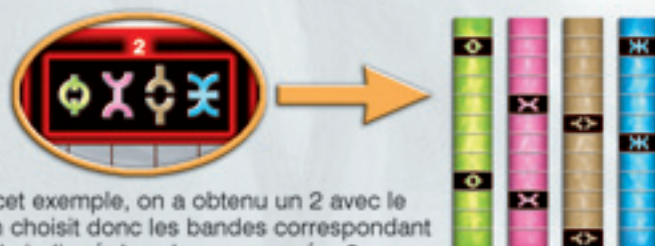
Dans cet exemple, on a obtenu un 2 avec le dé. On choisit donc les bandes correspondant au code indiqué dans la case numéro 2.

Sur le bord des tableaux se trouvent, en haut et en bas, 8 petites cases avec un code (numérotées de 1 à 8). Le chiffre obtenu par le dé indique lequel des 8 codes on doit reconstituer. Pour ce faire, les joueurs choisissent parmi leurs bandes celles dont les signes correspondent au code à retrouver. Si le dé indique par exemple un 2, chaque joueur prend les bandes indiquées dans la case 2 de son tableau.