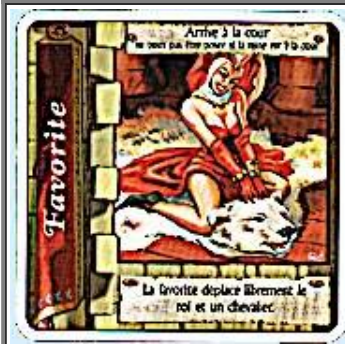
Cartes arrivant à la cours (bannière rouge)

Si des soldats sont protégés par leur capitaine, ils restent en place mais le capitaine, qui ne se protège pas lui-même, est renvoyé.