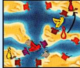
Illustration 3c: c'est au tour de Jacques, il doit obligatoirement déplacer son capitaine rouge, car le bateau jaune de Sandrine (qu'il ne doit pas déplacer) lui permet d'atteindre l'île voisine.

Illustration 3b: Sandrine déplace son bateau afin de ne plus pouvoir déplacer son capitaine (qui reste exceptionnellement à sa place). Comme l'île voisine est occupée par le capitaine rouge, elle doit sauter le bateau rouge pour atteindre une île non occupée. (Si le bateau rouge ne se trouvait pas à cette place, le capitaine de Sandrine ne pourrait pas se déplacer.)