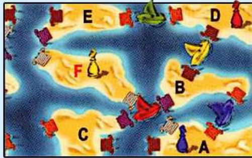
Illustration 4a: grâce à son propre bateau, Pierre peut déplacer son capitaine bleu de l'île A à l'île B. Mais il peut aussi utiliser le bateau rouge pour aller jusqu'à l'île C. Comme le capitaine rouge se trouve déjà sur l'île D, Pierre ne peut pas y installer son capitaine. Grâce aux bateaux jaune et vert, il peut aussi atteindre l'île E.