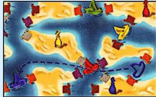
Illustration 4b: comme Pierre n'a pas envie de placer son capitaine sur une des île non occupées et accessibles, il commence son tour en enlevant son bateau. Après le déplacement de son bateau, il n'y a plus de communication avec les autres îles et son capitaine ne peut donc plus se déplacer.

Illustration 4a: grâce à son propre bateau, Pierre peut déplacer son capitaine bleu de l'île A à l'île B. Mais il peut aussi utiliser le bateau rouge pour aller jusqu'à l'île C. Comme le capitaine rouge se trouve déjà sur l'île D, Pierre ne peut pas y installer son capitaine. Grâce aux bateaux jaune et vert, il peut aussi atteindre l'île E.