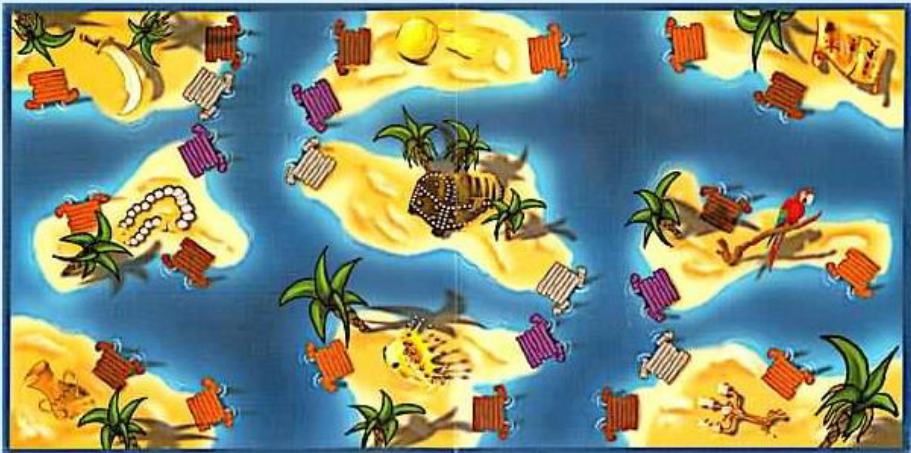
Plateau de jeu (taille réelle = 40 x 20 cm)