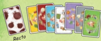
7 cartes Catégorie avec 7 couleurs de fond différentes