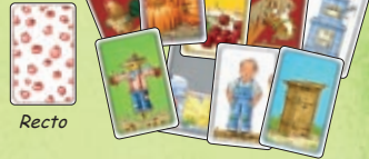
49 cartes Objet déclinées en 7 couleurs différentes