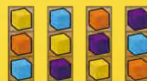
Demandes de la ville

7) Placer au hasard les 8 jetons Palais , face jaune visible , sur les 8 emplacements (G). Les emplacements (H) restent vides.