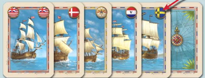
Les compagnies sont originaires des nations (de gauche à droite) : Angleterre, Danemark, France, Pays-Bas, Suède