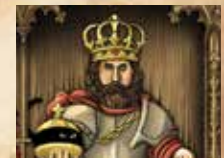
F) Titre de noblesse