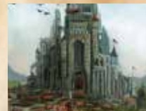
D) Nouvelle cité