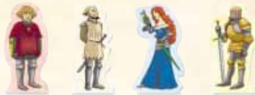
Pastilles de combat