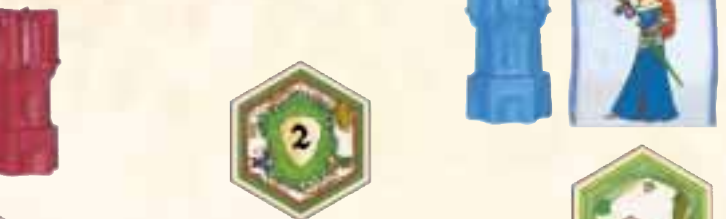
Tuile de départ du plateau