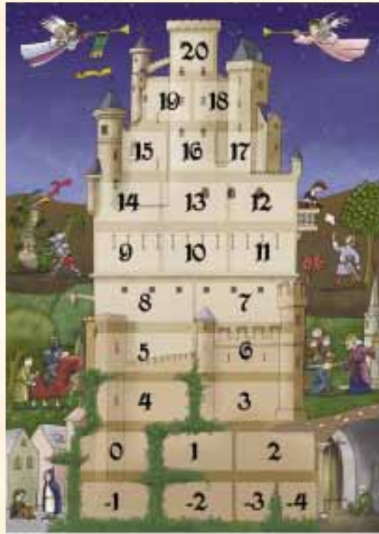
Plateau des points d'honneur

Le joueur choisit le village. Cela lui coûte 1 point d'honneur. La prairie glisse en deuxième position. Puis le joueur prend une tuile de la pioche et la pose en troisième position.