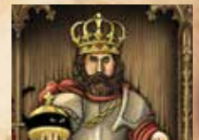
F) Titre de noblesse