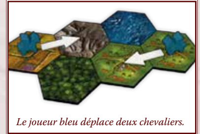
Le joueur bleu déplace deux chevaliers.

Aucune limite n'est imposée au nombre de vos chevaliers présents sur un même hexagone.