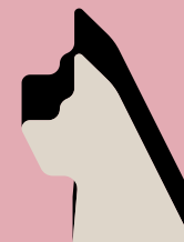
Chien de Garde