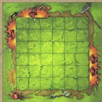
Schéma 3 - Avancer le Soleil