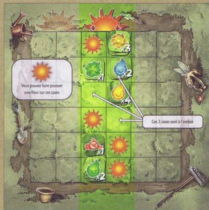
Schéma 2 - Zones d'ombre

Dans l'exemple, les fleurs ci-dessous peuvent pousser.