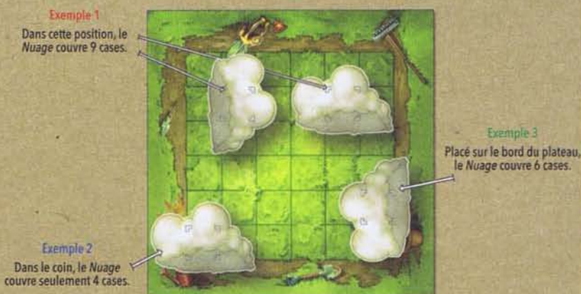
Exemple 1 Dans cette position, le Nuage couvre 9 cases. Exemple 2 Dans le coin, le Nuage couvre seulement 4 cases. Exemple 3 Placé sur le bord du plateau, le Nuage couvre 6 cases. Schéma 4 - Le Nuage

Le support du Nuage doit toujours être centré sur une case. De cette façon, le Nuage placé dans un coin recouvrera 4 cases; placé sur un bord, 6 cases; et placé à l'intérieur du plateau, 9 cases.