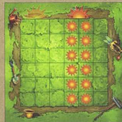
Schéma 1 - Ensoleillement

Ce jeton fleur (la fleur fanée) est détruit. Mettez-le de côté pour le reste de la partie.