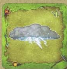
COUP DE TONNERRE