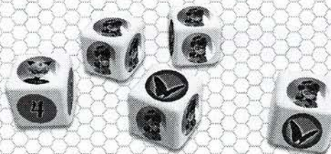
Dés de combat

Si c'est la première fois que vous jouez, collez les autocollants sur les dés de combat (chacun avec 4 faces Ladybug et 2 faces akuma) et sur le dé de déplacement (2-3-3-4-Yoyo-Chat Noir).