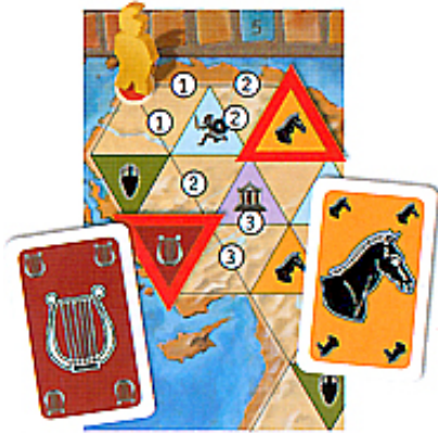
Illustration 1 : Alexandre est sur le point rouge de début de partie et les deux cartes faces visibles sont la Lyre et le Cheval. Alexandre peut ainsi être déplacé sur une intersection de la case la plus proche et disponible avec un de ces symboles.

La case de cheval du bas (le point le plus proche est distant de 3 lignes) n'est pas autorisée, puisque la case de cheval du haut (le point le plus proche est distant de 2 lignes) est la plus proche de ce type. Si le joueur choisit la carte de cheval, Alexandre doit être déplacé sur un point d'intersection de la case de cheval supérieure.