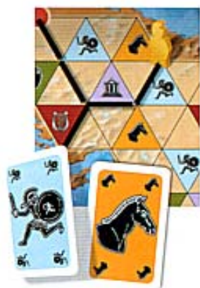
Illustration 3 : le joueur actif a choisi la carte Hoplite. Il y a 3 cases voisines avec ce symbole - au nord, à l'est et au sud-est. Toutes 3 sont à une distance égale de la position actuelle d'Alexandre, à savoir 2 lignes (la position laissée dans l'exemple 2). Le joueur peut donc choisir librement sur laquelle de ces 3 cases déplacer Alexandre - il choisit la case à l'Est. Il y place Alexandre sur le point supérieur. Après le placement des deux murs de frontière (plus 1 qui était en réalité déjà en place) il a créé une petite province composée de 4 cases vides et 3 avec symbole.

Une province devrait (mais pas obligatoirement) toujours contenir au moins une case avec symbole - sinon elle est sans valeur, ne pouvant être occupée. (Une seule case avec symbole peut être considérée comme province. Cependant, ne rapportant aucun point lors de la collecte d'impôts, cela vaut rarement la peine de créer une telle province).