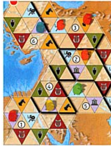
Illustration 6 : Rouge veut collecter des impôts et se défausse d'une carte Hoplite parce que l'un de ses gouverneurs est présent sur une case Hoplite (la province 3).

Les impôts peuvent seulement être collectés une fois par tour du joueur.