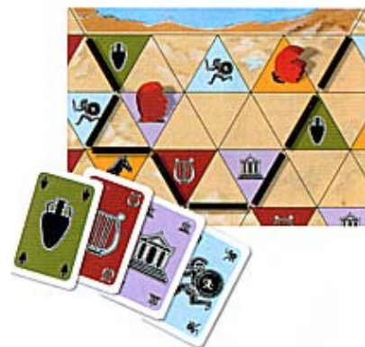
Illustration 4 : Rouge occupe cette province constituée de 9 cases vides et de 6 cases avec symbole en plaçant un de ses gouverneurs sur la case « temple » et un autre sur la case « cheval ». Pour les 4 autres cases de symbole, il se défausse d'une carte correspondante pour chacun (l'Amphore, Hoplite, la Lyre et le Temple).

S'il avait été aussi en possession d'une carte « Cheval » ou d'une carte « Temple », il aurait pu se défausser de l'une d'entre elles au lieu du placement du deuxième gouverneur.