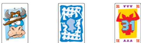
Carte Buffle Carte Vachette Première défausse

Mise en place des cartes en début de partie