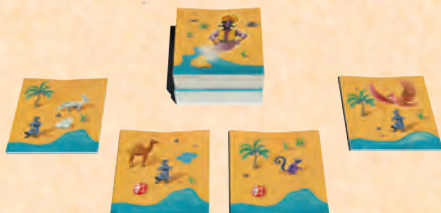
Exemple à 4 personnes

La Vigie pose sur la table, faces visibles, les tuiles piochées.